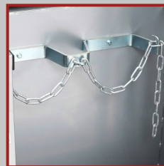
Sichere Halterung der CO2- Flaschen