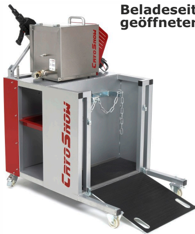
Beladeseite mit geöffneter Rampe