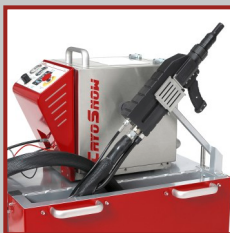
Staufach für das Schlauchpaket und Halterung der Strahlpistole