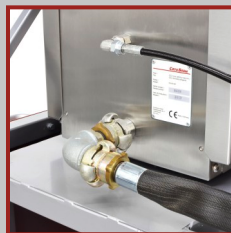
CO2- und Druckluft-Anschlüsse über 90°-Winkel